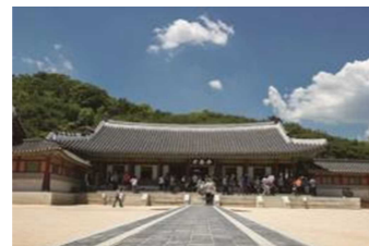
王が宿泊した華城行宮内の奉壽堂 (ポンスダン)