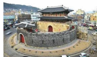
水原華城の南門の八達門 (パルタルムン)

2024年は、韓国の水原(スウォン)市と旭川市の友好都市提携35周年の年となり、これを記念し、これからも末永く交流が続くことを願うとともに、韓国から来られる多くのお客様をお出迎えする気持ちを込めたイメージでデザインしてください。