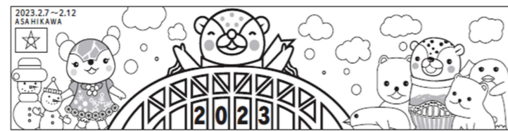
第64回の作品「旭川が大すき！」