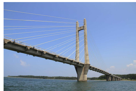
サンセットブリッジ